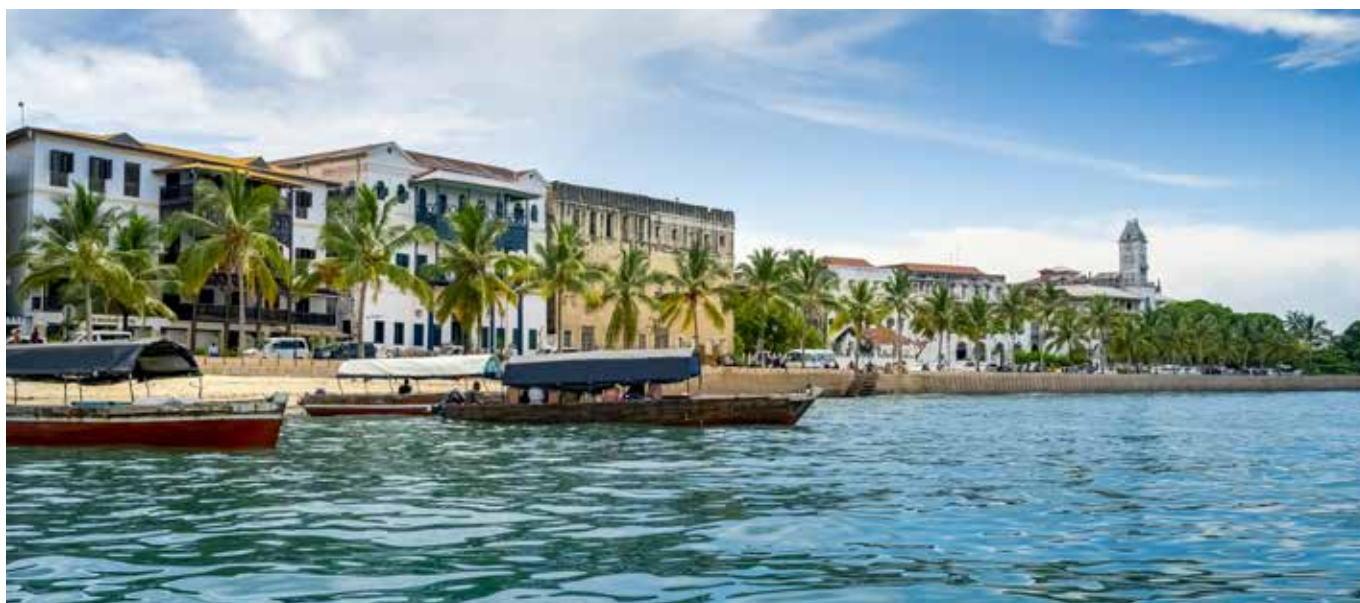
Stone Town, panorama.

Immane è la visita a Stone Town, la capitale storica, le escursioni alle isole vicine (Nakupenda e la Prison Island) e la degustazione di cibi con spezie fuori dal comune con sapori forti ed intensi. È impossibile non andare a Nakupenda, nota come la "spiaggia che scompare" è un'esperienza straordinaria un paio d'ore con una imbarcazione rudimentale da pesca, improvvisata per il trasporto dei turisti, questa spiaggia ha una lingua di sabbia bianchissima circondata da un mare turchese, che emerge e scompare con la marea. Offre snorkeling eccellente e un pranzo a base di pesce fresco preparato in loco dai pescatori che riescono a creare un'atmosfera paradisiaca, trasportano con le loro imbarcazioni tavoli, sedie, tovaglie con attrezzi da cucina, il barbecue per arrostitire pesce appena pescato, l'atmosfera delle candele accese sulla tavola apparecchiata fa il resto, con la possibilità di una vi-