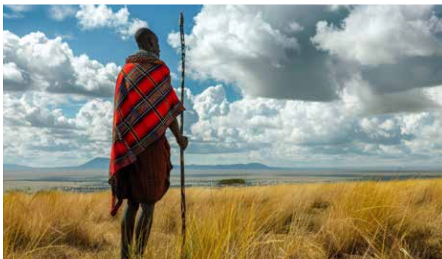
Guerriero Maasai con scialle tipico schuca.

La Tanzania è un paese dell'Africa orientale apprezzato per le vaste zone selvagge, comprende le praterie del Parco Nazionale del Serengeti, meta per i safari, abitata dai cosiddetti Big Five (elefante, leone, leopardo, bufalo e rinoceronte), e il Parco Nazionale del Kilimangiaro, dove sorge la montagna più alta dell'Africa. Al largo della costa si trovano le isole tropicali di Zanzibar, influenzata dalla cultura araba, con un parco marino dove nuotano squali balena e incantevoli barriere coralline.