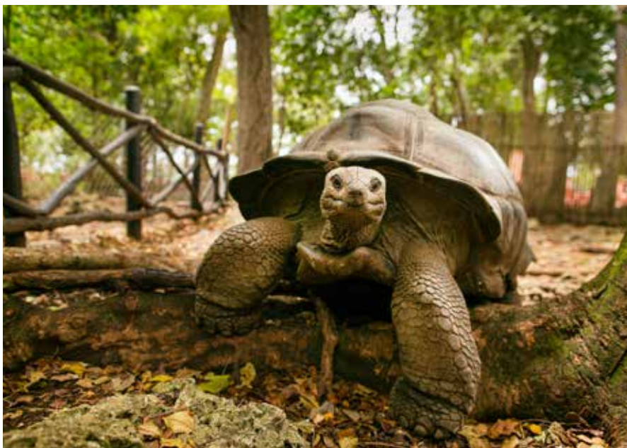
Tartaruga nel Santuario di Prison Island.

sita inaspettata delle tartarughe giganti di Prison Island. La Prison Island nota anche come Changuu Island, è una piccola isola situata a circa 6 km a nord-ovest di Stone Town, a Zanzibar, famosa per ospitare un santuario di tartarughe giganti di Aldabra e le rovine di un'antica prigione. Inizialmente fu destinata al confino, l'isola è poi diventata popolare per l'attrazione turistica per la natura incontaminata, lo snorkeling e le testimonianze storiche. L'atollo di sabbia corallina bianchissima emerge solo durante la bassa marea, creando un paesaggio suggestivo che viene sommerso dalle acque cristalline. L'isola ospita un santuario con tartarughe giganti di Aldabra, alcune delle quali hanno oltre 100 anni e pesano diversi quintali. Gli esemplari furono portati dalle Seychelles alla fine del XIX secolo. La prigione invece fu costruita nel 1893, era intesa per detenuti, ma in realtà non fu mai utilizzata per questo scopo, servendo invece come sta-